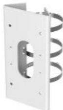
DS-1276ZJ-SUS Крепление на столб